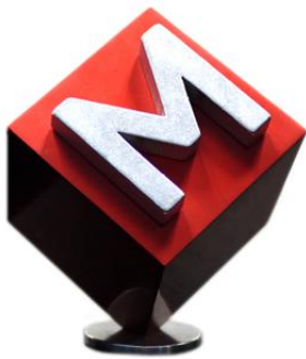
最佳本地公關顧問獎

(亞太區，2013年5月30日)－縱橫公共關係顧問集團(「縱橫公關集團」或「集團」)昨晚於《Marketing》雜誌在香港舉行的2013年「年度最佳營銷代理」頒獎典禮上榮獲 最佳本地公關顧問獎 ，集團一直致力為客戶提供優質公關服務，四度蟬聯此業界殊榮，凸顯其出色表現及專業水平。而縱橫公關集團新加坡分公司亦於新加坡舉行的同一頒獎典禮上，獲選為 新加坡十大公關公司 。